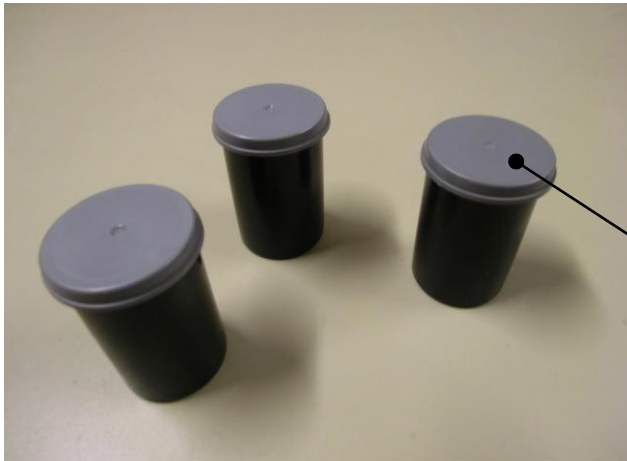
Filmdoosje (of ander afsluitbaar plasticdoosje)