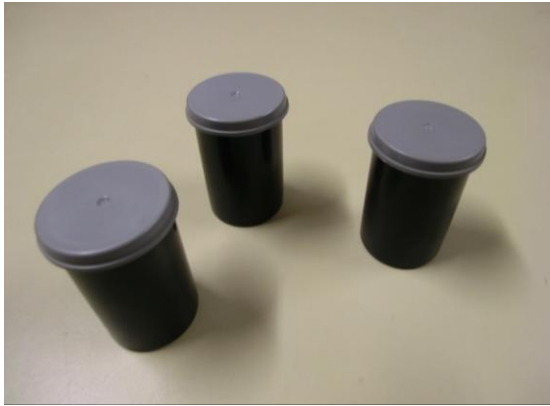
Boîte de film (ou autre boîte en plastique scellable)