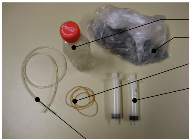
Petite bouteille PET