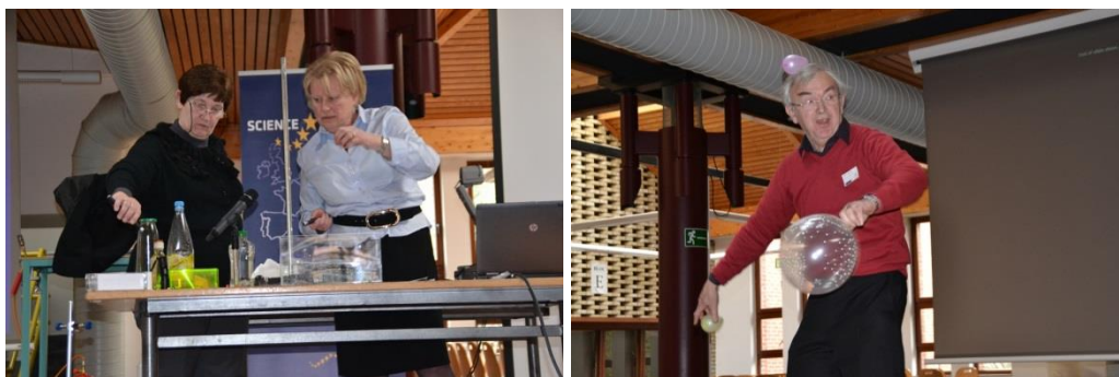
La présentation du kit d'expériences remis aux participants