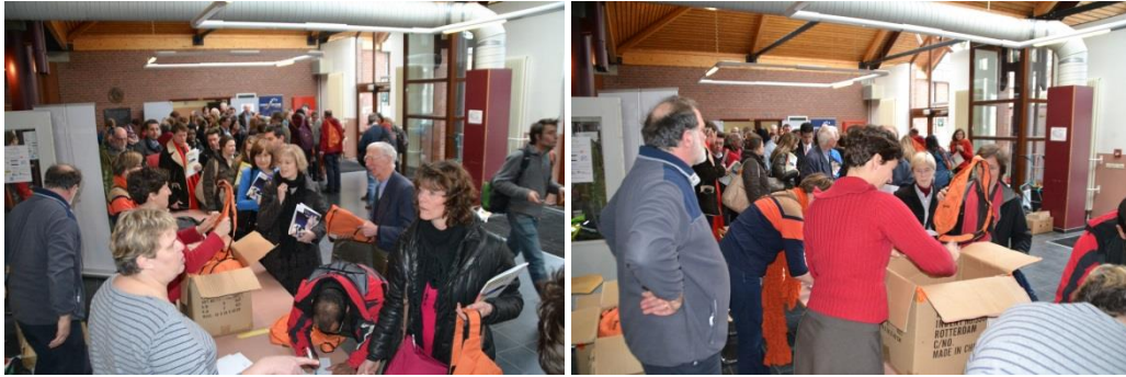
La distribution des kits à chaque participant