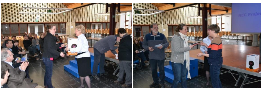
Les prix du quiz