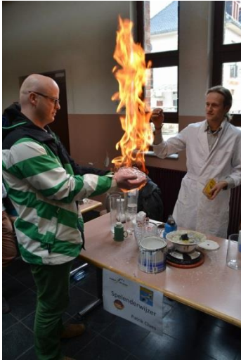
LA FOIRE AUX EXPERIENCES: plus de 30 stands d'expériences